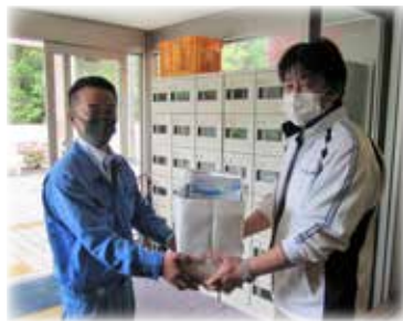
【有限会社日置川清掃様マスク寄贈】