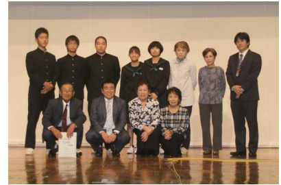
【地域福祉のひろば登壇者の皆さま】