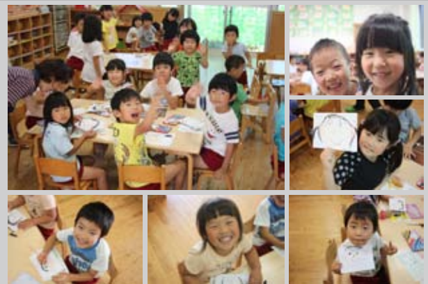
みんなで元気にプレゼント製作中です!!