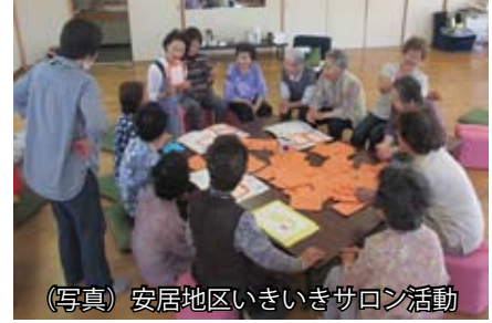
(写真) 安居地区いきいきサロン活動