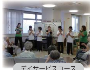
デイサービスコース

※体験施設までの移動は、各自で行ってください。詳細は通学されている学校または社協白浜本部までお問合せ下さい。参加申し込みをお待ちしています。