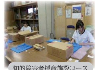
知的障害者授産施設コース