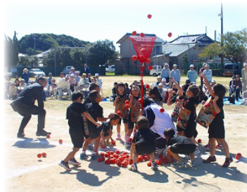
～園児参加の玉入れ競争の様子～

フルな動きに場内が沸き、たくさんの笑顔の花が開いた元気いっぱい運動会となりました。