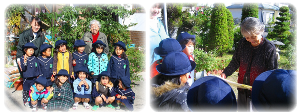
【堅田保育園児による訪問風景】

保育園児による高齢者宅への訪問やいきいきサロンでの交流、幼稚園・保育園児からの心のこもった贈り物、ボランティアによる手づくりのチラシ寿司などが届けられました。みなさんのご協力ありがとうございました。これらの活動をとおして、世代間交流の機会の推進に努めていきます。