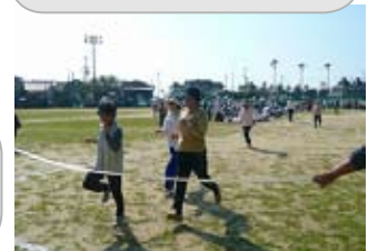
日置川支部大会 ～50m走の様子～