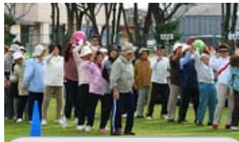
白浜支部大会 ～ボール送り競争の様子～

させないパワフルな動きに場内が沸き、たくさんの笑顔の花が開いた元気いっぱいの運動会となりました。