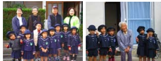
【堅田保育園児による訪問風景】

保育園児による高齢者宅への訪問やいきいきサロンでの交流、幼稚園・保育園児からの心のこもった贈り物、ボランティアによる手づくりのチラシ寿司などが届けられました。みなさんのご協力ありがとうございました。これらの活動をとおして、世代間交流の機会の推進に努めていきます。