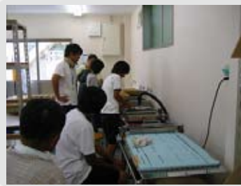
知的障害者授産施設コース