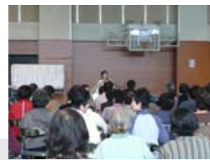
音楽を通して楽しむ、笑う!

午後からは、合併後広い範囲の活動となったボランティア同志の交流として、玉入れや白浜音頭・日置川小唄の盆踊りで賑やかに楽しい時間を過ごしました。